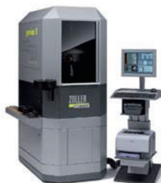
»genius 3« mit »microsensor« A forgácsolószerszámok univerzális mérőgépének mikroszenzorral való kiegészítése a mikrogeometriák érintés nélküli, ultraprecíz méréséhez