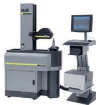
»venturionTopoCAM« A legújabb generációs 3D digitalizálás, bemutatva a ZOLLER és a GFMeStechnik kooperációjában