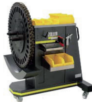
»eQuick 200« Ergonomikusan kialakított megoldás az optimális felszerszámozásra, ill. többelű főtengelymarók lapkázására