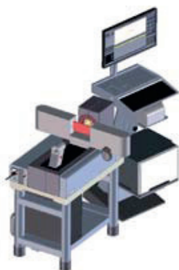
»pomDiaCheck« Mérőgép a forgácsolószerszámok átmérőjének folyamatközeli, precíz \mu -pontosságú méréséhez