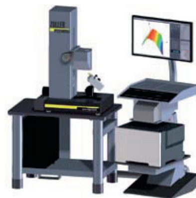
»pomEdgeCheck CNC« Beállító- és mérőgép a vágóél-lekerékítés komplett kivitelezéséhez CNC vezérelt lineáris tengellyel és „Autofocus” funkcióval