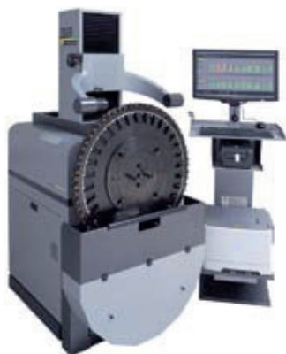
»gemini 2« Főtengelymarók beállításának és mérésének új generációja