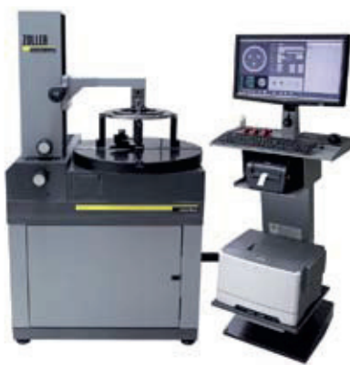
»aralonBasic« ZOLLER megoldás a belső szerszámélel rendelkező főtengelymarók folyamatközeli méréséhez