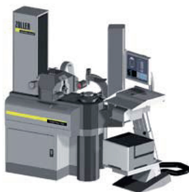
»hobCheck« Univerzális „zseni” a lefejtőmarók gyártásközeli és gazdaságos komplettméréséhez